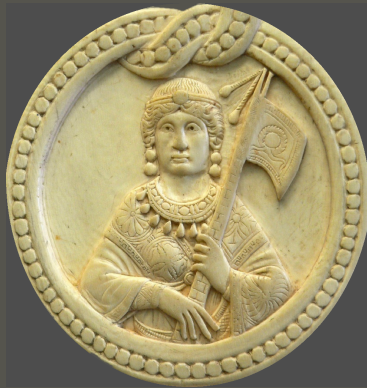
Buste de femme personnifiant Constantinople, détail du Diptyque consulaire de Théodorus Philoxenus Sotericus, Paris, Cabinet des Médailles